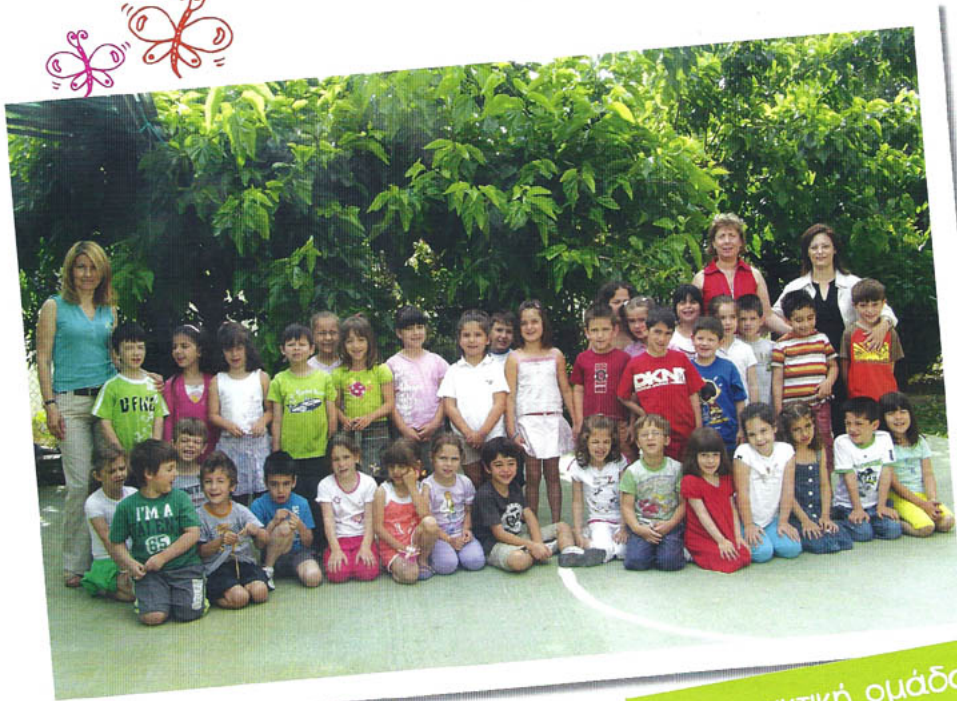
Η συντακτική ομάδα